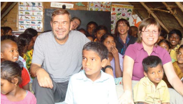
Te gast in een bridge school in de slums van Hyderabad

In februari 2011 verzamelden 200 coördinatoren en animatoren van de beweging in Hyderabad voor opleiding en evaluatie. Het is de jaarlijkse bezinning van de beweging over het traject dat ze aflegt. Samen met Peter Adriaenssens werden de realisaties van de eerste vijf jaar overlopen, en nieuwe doelstellingen aangenomen. Vooral het project 'bridge schools' staat daarbij in de kijker.