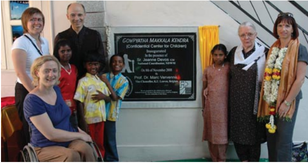
Officiële opening eerste crisisopvangcentrum in Bangalore

In hetzelfde jaar werd het eerste crisisopvangcentrum afgewerkt met steun van het fonds, in Bangalore.