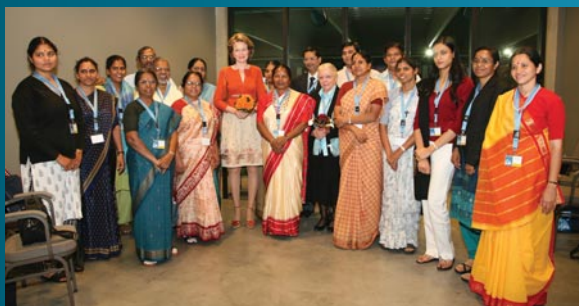
30 coördinatoren uit India komen naar Leuven

In 2007 was de beweging in Patna onze gastheer, om een week lang kennis te maken met de problemen waar kinderen in huisarbeid mee geconfronteerd werden, hun symptomen, hun ontwikkelingsvaardigheden en -tekorten. Samen met de vrouwen uit de projecten in de sloppenwijken werd ingeschat hoe hun competenties konden versterkt worden om dit in de eerste plaats zelf een antwoord te bieden.