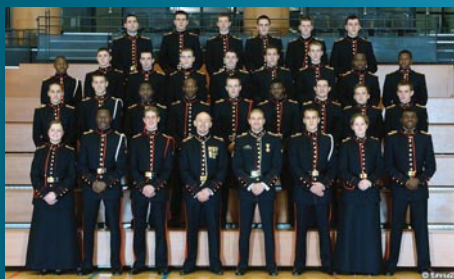
Bal Koninklijke Militaire School Brussel