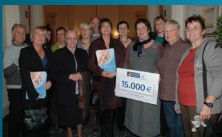
Stop Armoede van Groep Arco