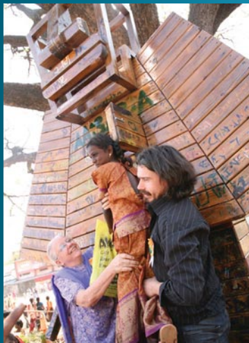
Kinderen vertrouwen hun dromen toe aan de CosmoGolem in Mumbai