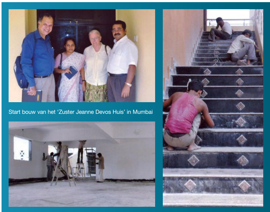
Start bouw van het 'Zuster Jeanne Devos Huis' in Mumbai