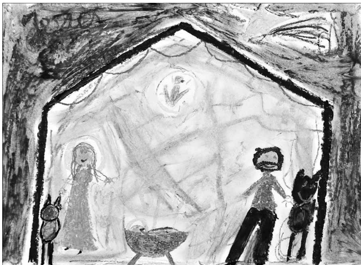
Op een adventskransje kunt u ideeën uitwisselen met mensen waarvan u weet dat ze ook zinvol vorm willen geven aan de advent.

Of waarom niet met het hele gezin op de adventszondagen een contemplatieve dialoog voeren? U herleest langzaam en aandachtig het evangelie van die dag en iedereen schrijft op een vel (boter)papier het woord of de zin die heel bijzonder aanspreekt. Deze niet-moraliserende omgang met een Bijbeltekst spreekt vaak ook jongeren aan. Het papier wordt