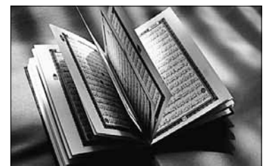
Een Arabische Koran.