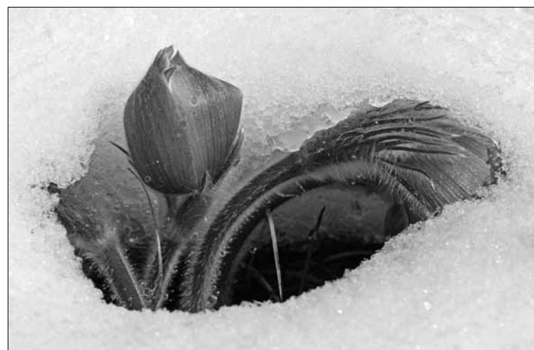
Voor wie ooit onrecht werd aangedaan en soms nog worstelt met die kwetsuren, is de Groeigroep in Vergeving misschien een steun.

Hij tekende een traject van twaalf stappen uit, die voor elke mens herkenbaar zijn. Via vorming, gesprek en bezinning gaan we met een kleine groep op weg. Het is een weg van rouwen en groeien, van nieuwe inzichten