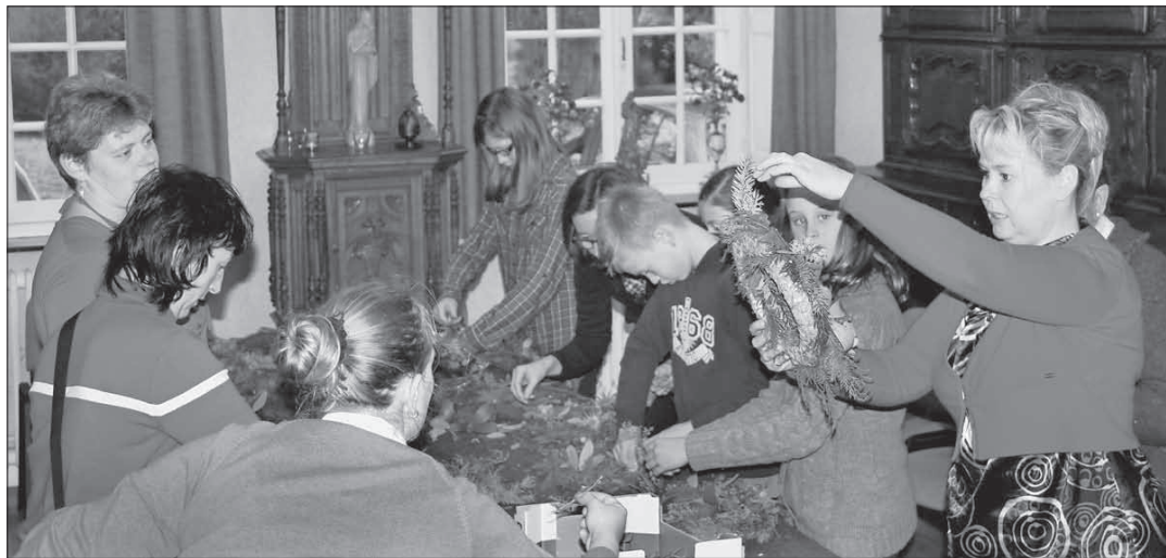
Een adventskrans maken was één van de zeven activiteiten tijdens de eerste ‘catechese op zondag’ in Eeklo eind november.

Reynvoet en Van de Voorde waren twee van de honderd deelne-